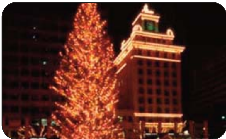
Luminarie su un albero e un grattacielo di Portland, USA