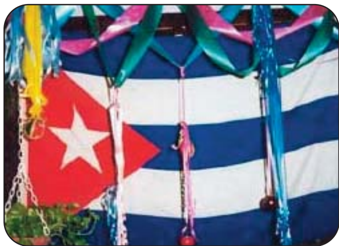
Bandiera cubana con addobbi natalizi

La rivoluzione del 1959 rappresenta uno spartiacque per i festeggiamenti natalizi. Inizialmente vietati o comunque scoraggiati, negli ultimi decenni a Cuba, i riti del Natale spagnolo sono tornati con tutta la loro forza e il loro colore. La notte di Natale (la Noche Buena ) le famiglie allargate anche agli amici si ritrovano per una cena tradizionale a base di maiale arrosto, yuca fritta e gli immancabili fagioli neri con riso. Per dessert si mangia il torrone. Il tutto si conclude con una grande festa dove non può mancare la musica. Bisogna tenere bene in considerazione che la religione più diffusa sull'isola caraibica è la santería , una commistione tra gli antichi riti animisti importati dall'Africa e il credo cattolico.