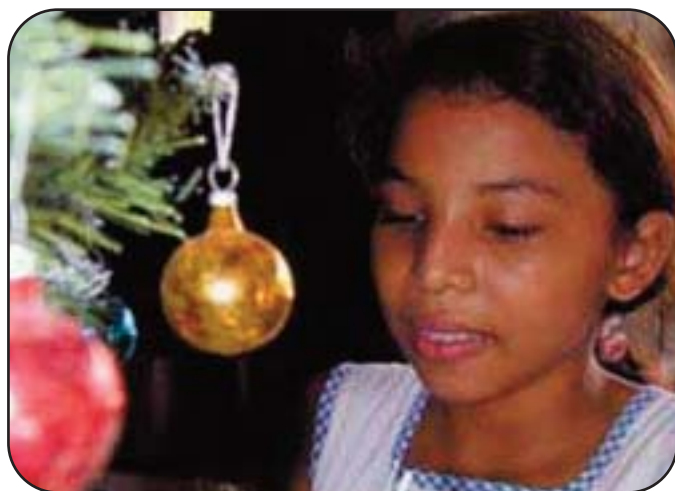
Una bambina colombiana addobba l'albero

scambio dei regali (portati da Gesù Bambino e non da Babbo Natale) e la messa di mezzanotte. Prima di andare a dormire si mangia l' ajiaco , una zuppa di patate, pollo e mandorle, mentre la bevanda tradizionale – piuttosto alcolica – è il Sabajòn (tequila, uova, latte, vino e whisky). Negli ultimi anni le tradizioni statunitensi si stanno però diffondendo: segno inequivocabile di questo fenomeno è la comparsa di numerosi Babbi Natale e l'introduzione del tacchino ripieno nel pranzo di Natale.