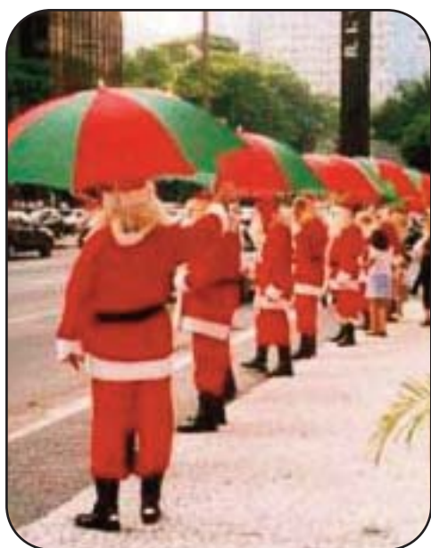
Babbi Natale sotto il sole di San Paolo, in Brasile

Un mix di genti e culture paragonabile agli Stati Uniti. Il Brasile è un paese ricchissimo di tradizioni assai lontane tra loro. Il presepe è diffusissimo nel nord-est del paese poiché qui (esattamente a Olinda, cittadina dello stato di Pernambuco) venne introdotto nel corso del Seicento dal frate francescano Gaspar de Santo Agostinho. La rappresentazione della nascita di Gesù Bambino è "arricchita" dalla presenza di alcuni zingari, che secondo la tradizione locale vogliono rapire Gesù. I regali ai piccoli li porta Papai Noel , versione carioca di Santa Claus. La messa di mezzanotte è seguita dal pranzo natalizio, la Ceia de Natal . Nelle più grandi città vengono innalzati grandi alberi arricchiti da centinaia di luci, e quasi dappertutto si