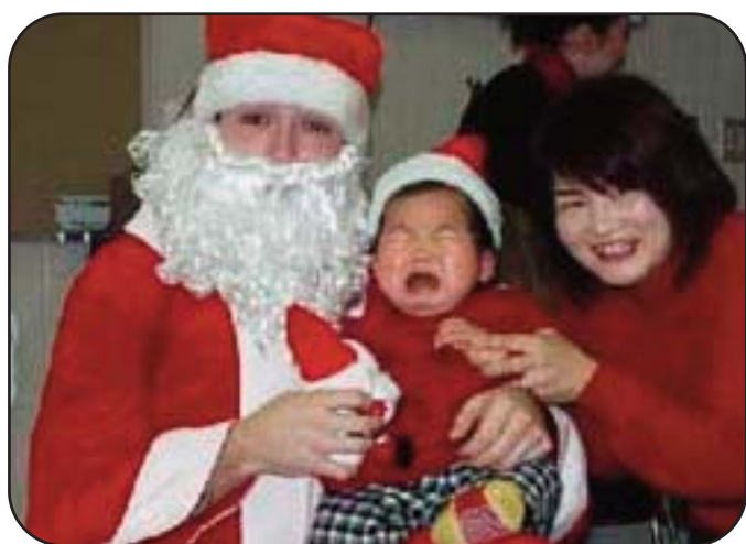
Curiosa scena natalizia in Giappone

impressionante di Babbi Natale, personaggio per cui gli abitanti di questo strano paese impazziscono. Il vecchietto vestito di rosso qui viene chiamato anche Santa Kurohsu , e a volte viene raffigurato con un paio di occhi anche sulla nuca, una particolarità da attribuire al fatto che nel pantheon nipponico esiste una divinità - Hoteiosho - che porta dei regali ai bambini che si sono comportati bene, e che come caratteristica ha proprio un paio di occhi sulla nuca, con i quali può controllare meglio il comportamento