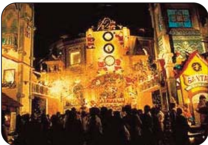
La notte di Natale a Singapore

Come in Giappone anche a Singapore gli aspetti commerciali del Natale hanno il sopravvento su quelli religiosi, nonostante qui i cristiani siano circa il 12% della popolazione. Il 25 dicembre è quindi un grande affare soprattutto per chi ha qualcosa da vendere. Babbo Natale regna incontrastato, ma qui e là fanno capolino anche alberi di Natale con tanto di neve finta.