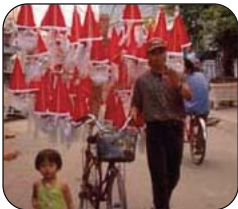
Un venditore ambulante di cappelli di Babbo Natale in Vietnam

La colonizzazione francese ha fatto sì che anche in Vietnam nascesse una piccola comunità cristiana. La messa di mezzanotte e il pranzo in famiglia sono le celebrazioni più diffuse, ma nelle grandi città è facile trovare anche alberi e alcuni Babbo Natale.