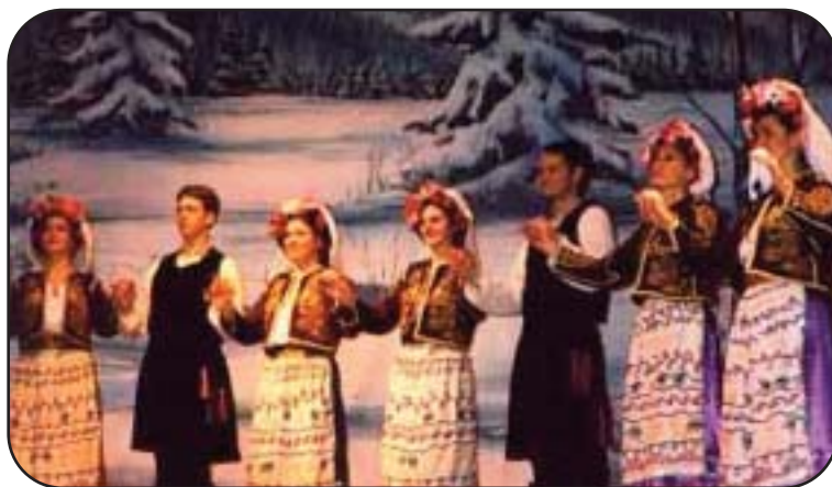
Un coro tradizionale greco durante un concerto di Natale

avverso i camini. Una volta insediatisi nelle abitazioni, non resistono alla tentazione di fare scherzi cattivi, come spegnere il fuoco, cavalcare la schiena delle persone, intrecciare le code dei cavalli e rendere acido il latte.