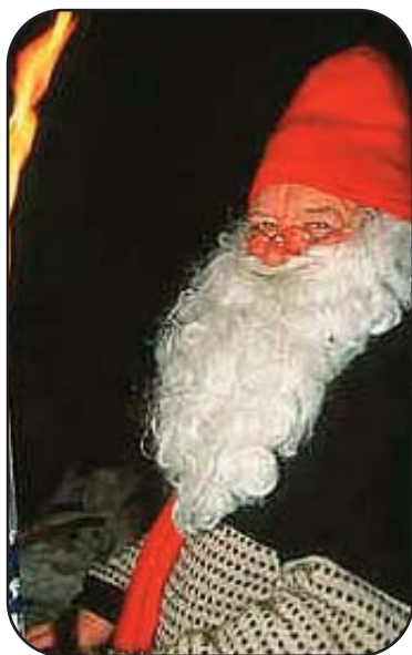
Un Babbo Natale norvegese