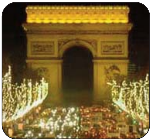
Gli Champs Elysée vestiti a festa

in alcune chiese vicino al mare, al termine della messa di mezzanotte, una processione di pescatori e di pescivendoli deposita ai piedi dell'altare un cesto colmo di pesce, in segno di affetto e riconoscenza verso il piccolo Gesù. Seguendo una tradizione risalente al 1803, gli artigiani provenzali modellano figurine di santi in argilla, poi inserite nel presepio. La tradizione vuole che la cena della notte di Natale termini con tredici dolci, preparati con frutta di stagione, che rappresentano Gesù Cristo e i dodici apostoli.