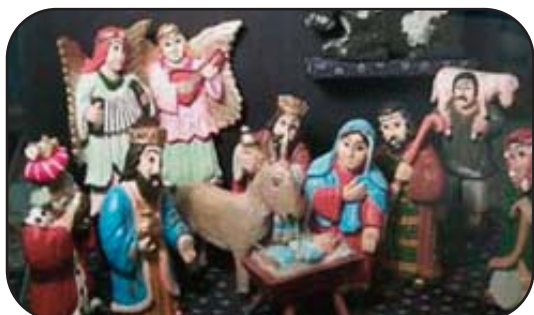
Un presepe polacco

a cura di Barbara Ciotola e Paolo Wilhelm