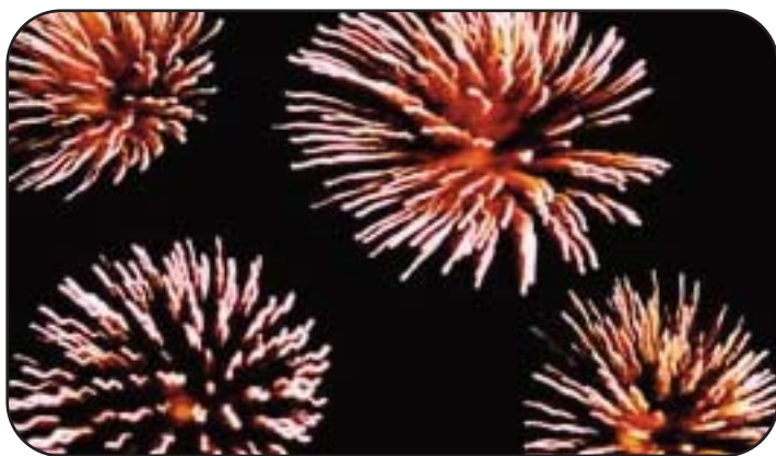
Fuochi natalizi nel cielo d'Islanda

Il Natale in Islanda comincia il 23 dicembre, quando si festeggia il giorno di San Thorlakur, in onore di Thorlakur Thorhallsson, antico vescovo della città di Skálhot. In lingua islandese i termini che individuano la festività del Natale sono Jol o Yule . I festeggiamenti per il Natale iniziano ufficialmente dopo le sei del pomeriggio, nel rispetto di una tradizione secondo la quale il giorno cominciava appunto nel tardo pomeriggio. Il cibo tipico del giorno di Natale è lo Hangikjöt , a base di carne di montone affumicata. Una delle tradizioni più caratteristiche del Natale islandese è quella degli Jolasveinar , i folletti di Natale, il cui compito è quello di molestare con scherzi impertinenti persone e animali. Sono tredici e ciascuno di loro ha un nome buffo che rispecchia la sua personalità: il Raschiatore di vasi, il Ladro di sal-