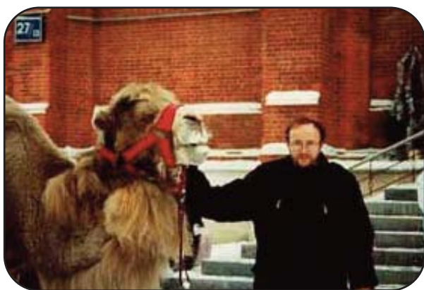
Un cammello portato sulla Piazza rossa per una rappresentazione della Sacra Famiglia

San Nicola di Mira è una figura popolare in Russia e protagonista di molte leggende. La più antica narra che nell'XI secolo il principe russo Vladimir viaggiasse verso Costantinopoli per farsi battezzare. Al suo ritorno in patria riportò fra i suoi conterranei molte storie sui miracoli del santo vescovo. È proprio San Nicola a portare i doni per grandi, piccini e persino animali: nei secoli passati, quando ricopriva questa funzione, veniva chiamato con il nome di Babouschka , ma dopo la Rivoluzione fu proibito ricordare la sua figura e le tradizioni a essa collegate. Si dice che Babouschka erri ancora per le contrade russe in cerca del Bambino Gesù e che per questo nel periodo natalizio visiti le case dove ci sono dei bambini. Per i russi il Natale si festeggia in gennaio. Per la cena della Vigilia, che per gli ortodossi cade il 6 gennaio, viene preparato una sorta di porridge chiamato Kutya . Gli ingredienti sono germi di grano, che simboleggiano la speranza dell'immortalità, miele e semi di papavero come augurio di felicità, successo e serenità. La Kutya viene versata in un piatto comune dal quale tutti si servono, a testimonianza dell'unità della famiglia. In alcune case la cena termina in modo originale, con il lancio