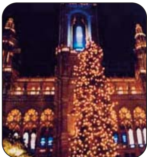
Un palazzo di Vienna

Bambino che si occupa anche di consegnare i doni per i più piccoli. Il primo segno dell'arrivo della festa di Natale è l'allestimento dei famosi "mercati di Gesù Bambino", molto amati dai bambini, che possono acquistarsi dolci, caramelle, biscotti. Anche la tradizione del presepio è molto diffusa in Austria: in alcune case la complessità della rappresentazione è notevole e accanto ai personaggi tipici si possono trovare figure con le sembianze dei diversi membri della famiglia. Il 6 gennaio, giorno dell'Epifania, giovani in costumi orientali, gli Sternsinger , si recano di casa in casa, cantando melodie natalizie. Sugli stipiti delle porte, le famiglie appendono le iniziali dei nomi dei Magi.