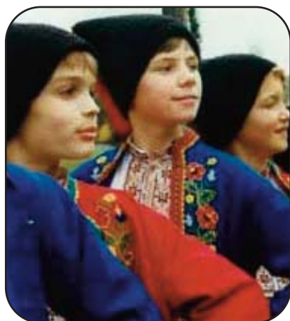
Bambini ucraini a una rappresentazione natalizia

In Ucraina, le tradizioni legate al Natale richiamano la commistione tra le usanze della Chiesa Ortodossa e le credenze religiose dei tempi pagani. Come in tutti i Paesi in cui la maggioranza della popolazione segue la liturgia ortodossa e il calendario giuliano, il Natale cade il 7 di gennaio. Lo scambio dei regali avviene nel giorno di San Nicola, affinché la festa della Natività conservi solo il suo significato spirituale.